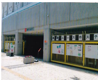
長居ユースホテル 入口 (長居競技場(キンチョウ・スタジアム内))