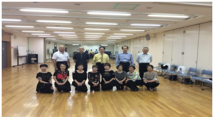
長居団体レッスン会員(2017.7現在)