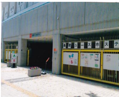
長居会場:長居ユースホテル 入口 (長居競技場(キンチョウ・スタジアム内))